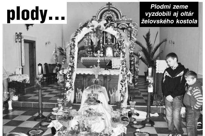
Plodmi zeme vyzdobili aj oltár želovského kostola