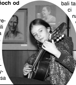
Otvorenie obohatili žiaci a pedagógovia ZUŠ Veľký Krtíš s poéziou a hudbou