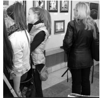
Výstavu si pozrelo vyše sedemsto návštevníkov

torov a rozmanitosť výtvarných techník. V porovnaní s predchádzajúcim ročníkom pribudli autori noví, ktorí vystavovali po prvý krát a nechýbali tam ani známi výtvarníci dosahujúci výsledky na krajských a celoslovenských výstavách. Popri maľbe a kresbe tentoraz bola na výstave zastúpená aj technicky náročná grafika.