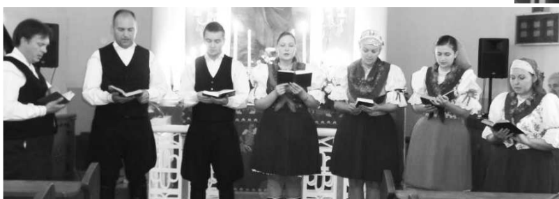
Folklorný súbor RADOSNÍK bol zlatým klincom programu