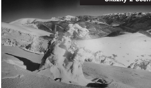
Ukážky z ocenených kalendárov