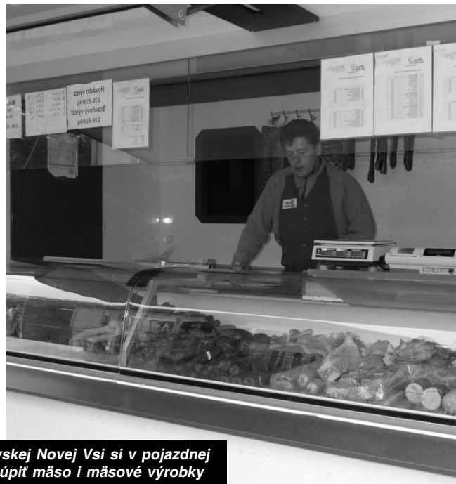
I obyvatelia Opatovskej Novej Vsi si v pojazdnej mäsiarni môžu nakúpiť mäso i mäsové výrobky

Do jedenástich obcí v juhozápadnej časti nášho okresu prichádza každý týždeň pojazdná mäsiareň z Horných Salíb v okrese D. Streda zo spoločnosti Dios Slovakia. Jednou z tých obcí je aj Opatovská Nová Ves. Jej obyvatelia si tak priamo z auta môžu nakúpiť mäso i mäsové výrobky, bez toho aby museli cestovať do miest, kde sú predajne mäsa. Ako nám povedal predávajúci a zároveň vodič spoločnosti, najradšej si ľudia kupujú údeniny - salámy, klobásy, údené mäso, tlačku a podobne. Samozrejme, že si ľudia kúpia aj čerstvé mäso, ale saláma vyhráva.