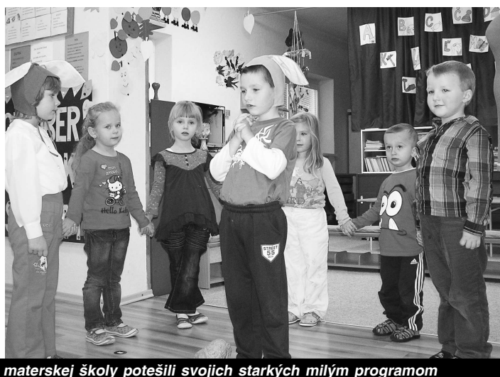
Deti zo záhorskej materskej školy potešili svojich starkých milým programom