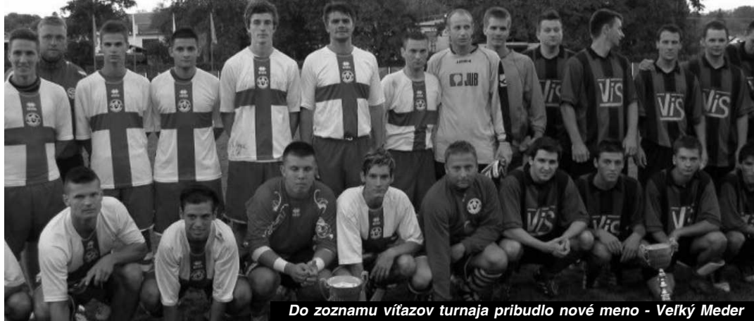
Do zoznamu víťazov turnaja pribudlo nové meno - Veľký Meder

DUDINCE - nachádzajú sa v krupinskom okrese ako miesto s najväčším počtom slnečných dní v roku. Ako druhé najmenšie mesto v republike má 1 521 obyvateľov a leží v nadmorskej výške 145 m n.m. Začiatok kúpeľníctva sa datuje do roku 1894, keď dekrétom boli dudinské minerálne vody uznané za liečivé. Hlavný "Kúpeľný Prameň" v hĺbke 52 m obsahuje veľa rozpustných látok, teplotu 28,5 °C a výdatnosť 17 l/s. Stabilná klíma vytvorila ideálne podmienky pre príjemný oddych v niekoľkých kú-