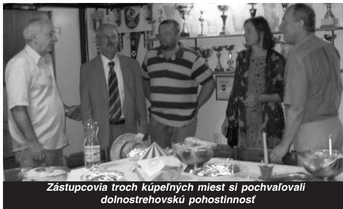
Zástupcovia troch kúpeľných miest si pochvaľovali dolnostrehovskú pohostinnosť

KOVÁČOVÁ - leží v okrese Zvolen, ako podhorská obec v nadmorskej výške 320 m.n.m. a má 1 467 obyvateľov. Začiatok kúpeľníctva siaha do roku 1 898, keď v rámci prieskumných vrtov na uhlie sa našiel horúci prameň 42 °C v hĺbke 405 m. Zložením a výdatnosťou patrí prameň medzi najbohatšie na Slovensku. Zaslúhou liečivej vody má v Kováčovej sídlo Národné rehabilitačné centrum a Špecializovaný liečebný ústav Marína. Termálne kúpalisko Holiday park je v rekonštrukcii.