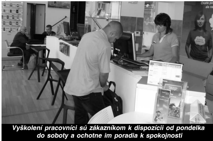
Vyškolení pracovníci sú zákazníkom k dispozícii od pondelka do soboty a ochotne im poradia k spokojnosti

"Ako jediní máme prepojenú internetovú stránku s navigačným systémom, takže miesto našej predajne sa dá nájsť veľmi jednoducho. Časť služieb poskytujeme aj pre káblovú televíziu, konkrétne