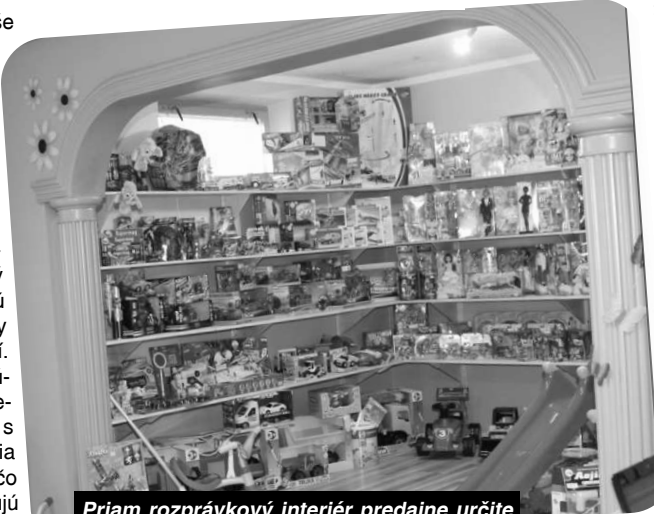
Priam rozprávkový interiér predajne určite nadchne nielen vaše deti ale aj vás

"Snažili sme sa, aby sa u nás cítili dobre hlavne deti. Interiér predajne sme si navrhli a urobili sami. Čo sa týka farieb a farebnosti, snažili sme sa ich zladit s