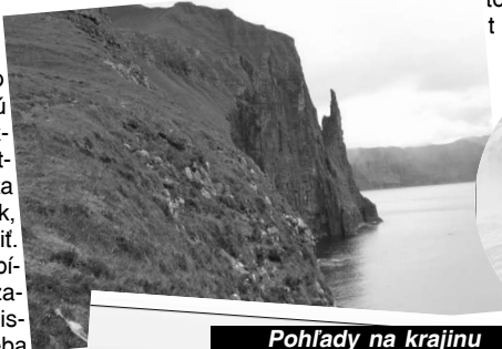
Pohľady na krajinu ako z rozprávky