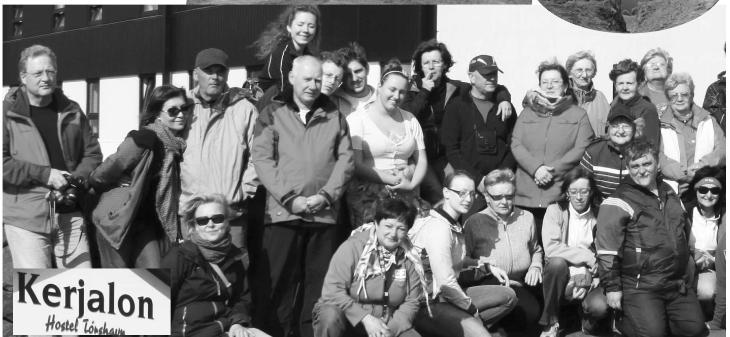
Kerjalon Hostel Tórshavn